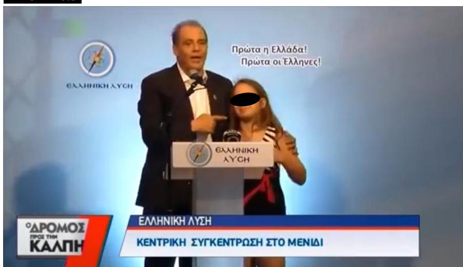
Προεκλογική ομιλία, 1 Ιουλίου 2019

Το παραπάνω απόσπασμα, εκτός των άλλων, αποτελεί και ένα παράδειγμα για τον τρόπο με τον οποίο η κάθετη και οριζόντια διχοτόμηση του κοινωνικού συνόλου μπορούν να λειτουργούν παράλληλα στο λαϊκιστικό λόγο. Σε αυτό το σημείο, αντι-ελιτισμός και «εθνολαϊκισμός» αλληλοσυμπληρώνονται, αφού «εχθροί» των Ελλήνων αποτελούν τόσο οι μετανάστες και οι ξένοι, όσο όμως και η πολιτική ελίτ, η οποία μισεί «εμάς» και βοηθάει τους «άλλους».