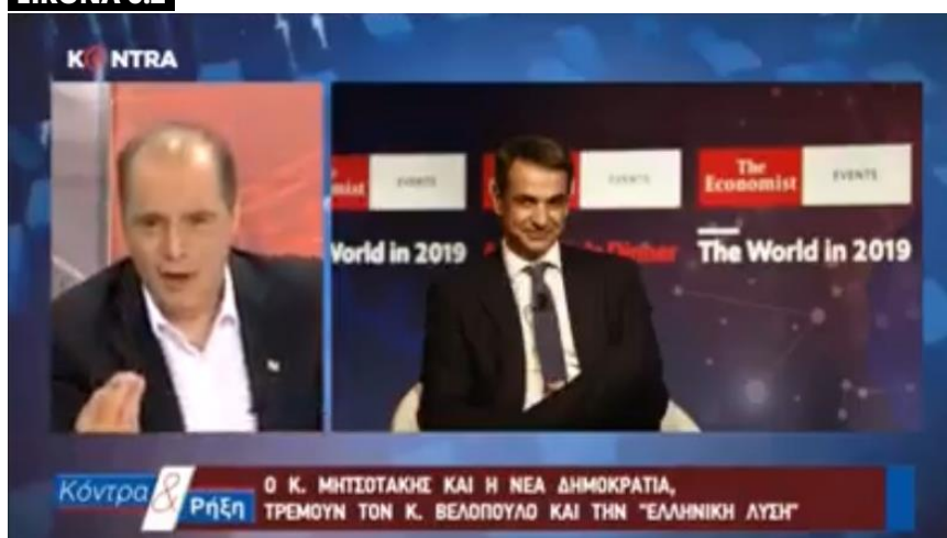
KONTRA, Κόντρα & Ρήξη, 4 Ιουνίου 2019

Κοιτάξτε φάτσα βγάλτε συμπέρασμα, δεν θα τα πω όλα εγώ. Καταλαβαίνομαστε τώρα, έτσι; Αυτός θα κυβερνήσει τώρα, τι να κάνουμε; Είχαμε το άλλο το ζαβό που φεύγει [Α. Τσίπρας], έρχεται ο άλλος τώρα [Κ. Μητσοτάκης]. Έτσι πάει η δουλειά στην Ελλάδα. Μπαίνει το ένα ζαβό, φεύγει και έρχεται ο άλλος. Ο άλλος, ο οποίος ψηφίστηκε όχι υπέρ του αλλά εναντίον του ζαβού που φεύγει. (Βελόπουλος 4/6/2019)