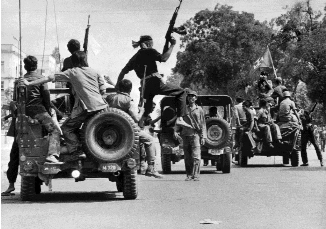
Οι Χμερ Ρουζ εν δράσει