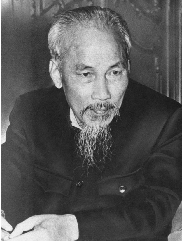
Ο Χο Τσι Μινχ με το τυπικό χιτόνιο που εισήγαγε ο Λένιν