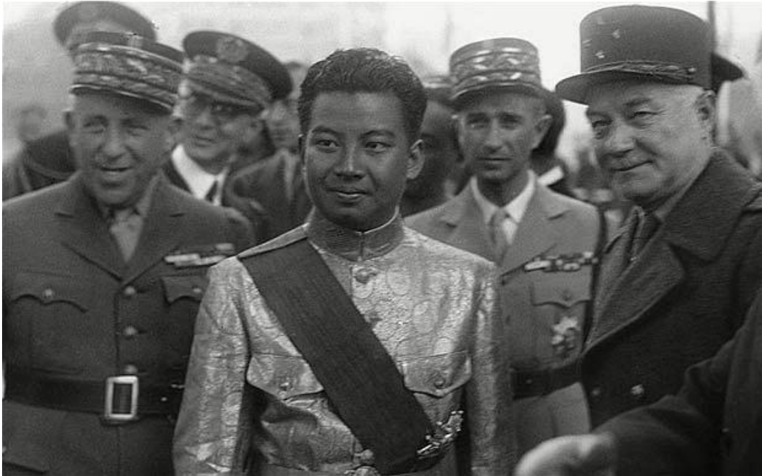
Ο πρίγκιπας Σιχανούκ περιτριγυρισμένος από τους Γάλλους αποικιοκράτες