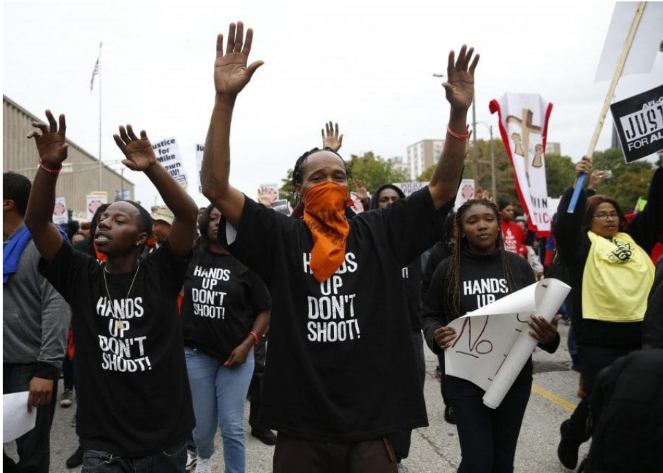
Εικόνα 5: Διαδηλωτές του Black Lives Matter με μπλούζες που αναγράφουν «Χέρια ψηλά, μην πυροβολείτε!» 18

Η δαιμονοποίηση των διαδηλωτών και η αναγωγή τους σε παράνομους ταραξίες παραγνωρίζει το μήνυμα των διαδηλώσεων και τους καταδικάζει για βία και άρνηση διαπραγματεύσεων (Hooker, 2016: 449). Η πραγματικότητα είναι ότι ο μαύρος πληθυσμός της Αμερικής έχει προσπαθήσει να παλέψει για την ισότητα του και την αναγνώριση της ανθρώπινης υπόστασής του με οποιαδήποτε πρακτική, στρατηγική και τεχνική υπάρχει. Από την εποχή της δουλείας ως τις ειρηνικές πορείες του κινήματος των πολιτικών δικαιωμάτων και τις κινητοποιήσεις του Black Lives Matter, το αποτέλεσμα συνεχίζει να είναι η δολοφονία μαύρων πολιτών για πταίσματα ή άλλες φανταστικές κατηγορίες. Στο όνομα της δημοκρατίας, το αμερικανικό κράτος καλεί σε πολιτισμένες πορείες και διαπραγματεύσεις με τους πολιτικούς παράγοντες, όπως έκανε και το κίνημα των πολιτικών δικαιωμάτων. Με αυτό τον τρόπο, απαιτεί από τους μαύρους πολίτες και τους συμμάχους τους να θυσιάσουν ακόμη περισσότερα και να περιμένουν για τη μέρα της απελευθέρωσης από το συστημικό ρατσισμό και την άκρατη βία. Σε αυτό το σημείο, το ζήτημα τίθεται στο κατά πόσο αυτή η δημοκρατική θυσία (Allen, 2004 στο Hooker, 2016: 449-469) που καλείται κάθε πολίτης να κάνει για το κοινό καλό είναι σωστά κατανοημένη. Ο όρος δημοκρατική θυσία παραπέμπει σε μια λειτουργία μέσω της οποίας η δημοκρατία συντηρείται με αμοιβαίες θυσίες από κάθε