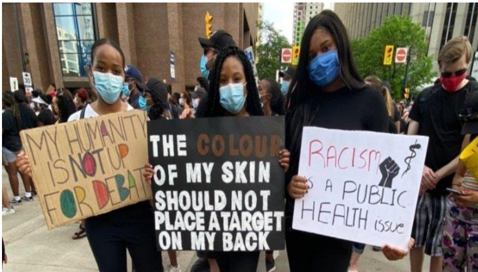
Εικόνα 9: Πλακάτ σε διαδήλωση του κινήματος. Από αριστερά προς τα δεξιά «Η ανθρώπινη υπόστασή μου δεν είναι ζήτημα προς συζήτηση», «Το χρώμα του δέρματός μου δεν θα έπρεπε να βάζει ένα στόχο στην πλάτη μου», «Ο ρατσισμός είναι ζήτημα δημόσιας υγείας» 40