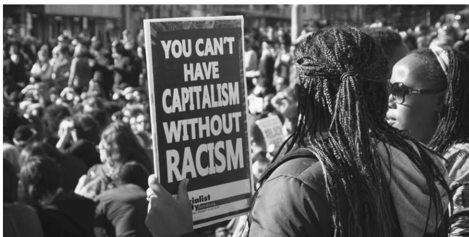
Εικόνα 7: Πλακάτ σε διαδήλωση που αναγράφει «Δεν μπορείς να έχεις καπιταλισμό χωρίς ρατσισμό» 35