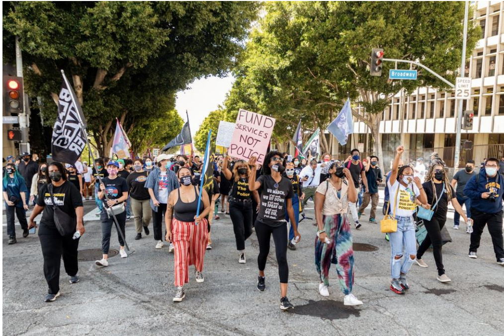
Εικόνα 6: Πλακάτ σε διαδήλωση που αναγράφει «Χρηματοδοτήστε τις Υπηρεσίες, όχι την αστυνομία» 28

Ως προς το ζήτημα της επιρροής του νεοφιλελευθερισμού στον τομέα της πολιτικής συμμετοχής, αξίζει να παρουσιαστούν κάποια στοιχεία που θα εξηγήσουν επαρκώς το πέρασμα στο μεταδημοκρατικό τοπίο, ώστε να κατανοηθεί και η συμβολή του κινήματος Black Lives Matter στην αναζωογόνηση της ενεργού πολιτικής συμμετοχής. Η διάχυση του νεοφιλελεύθερου λόγου και των αξιών του στην πολιτική σφαίρα οδήγησε σε μια έντονη ατμόσφαιρα απάθειας των ψηφοφόρων, οδηγώντας τελικά τη δημοκρατία των ΗΠΑ σε κρίση. Εντός ενός νεοφιλελεύθερου κράτους που προνοεί για τα συμφέροντα των επιχειρήσεων και της αγοράς σε βάρος των πολιτών η καταναλωτική εξατομίκευση τους είναι αναπόφευκτη. Ταυτόχρονα, αυτή η κρατική συμπεριφορά έχει κανονικοποιηθεί σε τόσο μεγάλο βαθμό ώστε η δυσaráεσκεια προς την πολιτική και τα κόμματα είναι δεδομένη. Ως εκ τούτου, η πολιτική δράση και η ενεργή συμμετοχή των πολιτών μετατρέπεται σε παθητική στάση και αδρανοποίηση, διότι θεωρείται ότι το παρόν σύστημα δεν δύναται να καταπολεμηθεί, οδηγώντας σε μια γενική συναίνεση με τις νεοφιλελεύθερες πολιτικές (Crouch, 2006: 8-10). Συγκεκριμένα, από την εποχή της θητείας του Ρέγκαν, η έννοια της δημοκρατίας συρρικνώθηκε τόσο για τους πολίτες ανάγοντας την πολιτική τους συμμετοχή στο δικαίωμα ψήφου στις εκλογές (Crouch, 2006: 67). Ως αποτέλεσμα, έχοντας αποκτήσει τη