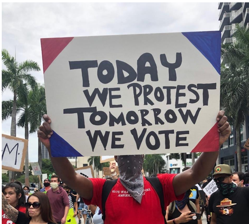
Εικόνα 13: Πλακάτ από διαδήλωση του κινήματος στις 7 Ιουνίου 2020 με αφορμή τη δολοφονία του Τζόρτζ Φλόυντ που αναγράφει «Σήμερα διαδηλώνουμε αύριο ψηφίζουμε» 56

διαδικασία πολιτικοποίησης στοχεύοντας στην απομάκρυνση του Προέδρου Τραμπ. Αυτό αποδεικνύεται και στο δελτίο τύπου του κινήματος στις 10 Σεπτεμβρίου 2020, στο οποίο το Black Lives Matter εξέφρασε την απογοήτευση του από τις δυο προεκλογικές εκστρατείες των υποψηφίων, διότι σε αυτές παραγνωρίζονταν οι μαύροι ψηφοφόροι και τα αιτήματά τους 55 . Παρόλα αυτά, έχοντας την επίγνωση πως ο Τραμπ αποτελεί σημαντική απειλή για το δημοκρατικό πολίτευμα και κίνδυνο για το μαύρο πληθυσμό, τους πρόσφυγες και τις λοιπές μειονότητες το κίνημα θεώρησε πως η στήριξη της εκστρατείας του Μπάιντεν κατέστη μονόδρομος για να αποφευχθεί η συνέχεια της θητείας του Τραμπ.