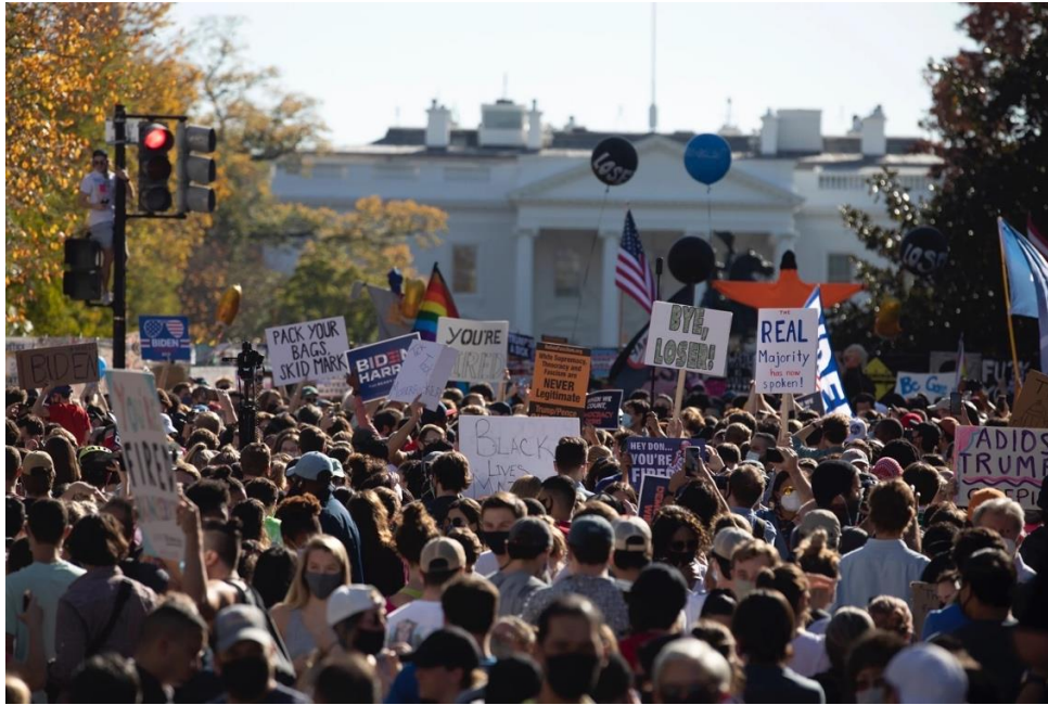
Εικόνα 14: Ο κόσμος γιορτάζει το Σάββατο 7 Νοεμβρίου 2020 στο Black Lives Matter Plaza απέναντι από τον Λευκό Οίκο στην Ουάσιγκτον, αφότου ο Τζο Μπάιντεν ανακηρύχθηκε νικητής των προεδρικών εκλογών του 2020 60

Η πολιτική συμμετοχή του κινήματος οδήγησε επιτυχώς στην απομάκρυνση του Τραμπ από την προεδρία, γεγονός που καθιστά το Black Lives Matter ένα επιτυχημένο κίνημα. Η επιτυχία αυτή είναι ακόμα σημαντικότερη διότι συνέβη μέσα στην καρδιά της μεταπολιτικής Αμερικής, η οποία κατέχει πρακτικές για την καταστολή των εκάστοτε συλλογικών δράσεων. Επιπλέον, το Black Lives Matter φαίνεται πως επηρέασε σημαντικά και την πολιτική σκηνή συνολικά, ανοίγοντας το δρόμο για την αντιμετώπιση ορισμένων μεταδημοκρατικών στοιχείων, όπως το δημοκρατικό έλλειμμα. Αυτή η παρατήρηση δεν συνεπάγεται την ανάδυση μιας υγιούς δημοκρατίας, ούτε σημαίνει το τέλος του θεσμικού ρατσισμού στις ΗΠΑ. Η πάλη για την εξάλειψη του ρατσισμού και την κατάκτηση των μαύρων ζώων ως άξιων να βιωθούν δεν σταματά μετά την θητεία του Τραμπ. Ως εκ τούτου, το Black Lives Matter αιτήθηκε να συναντηθεί με το νέο Πρόεδρο των ΗΠΑ με σκοπό να ανοίξει μια συζήτηση για νέες πολιτικές που πρέπει να εφαρμοστούν, αλλά και για την κατάργηση υπάρχουσών πρακτικών, όπως η αστυνομική βία 61 . Αυτή η κινητοποίηση επισφραγίζει την μετεξέλιξη του Black Lives Matter σε ένα κίνημα που συμμετέχει στις