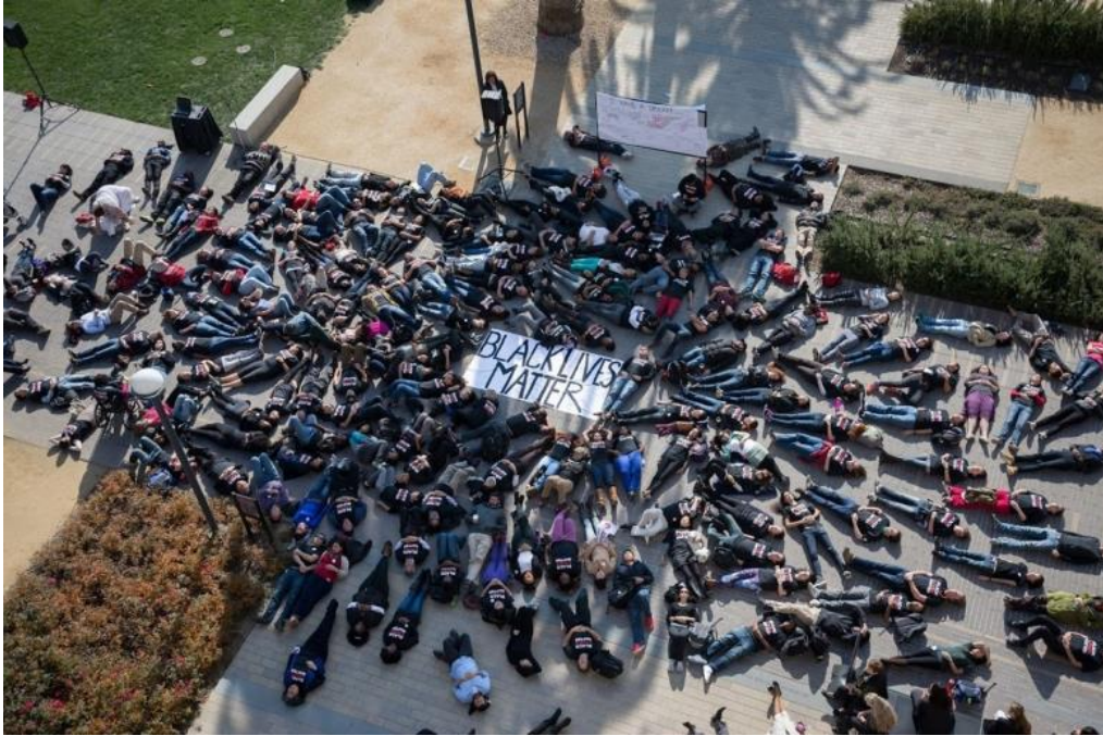
Εικόνα 2: Διαδηλωτές διαμαρτύρονται με τη μορφή «die in» 13