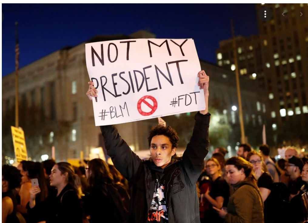
Εικόνα 12: Πλακάτ σε διαδήλωση μετά την εκλογή του Τραμπ το 2016 που αναγράφει «Δεν είναι δικός μου Πρόεδρος» 49

Η σταδιακή μετατροπή του κινήματος σε πολιτικοποιημένο συνδέεται άρρηκτα με τη θητεία του Τραμπ και καταρρίπτει την ιδέα πως ένα αποκεντρωμένο και αυτό-οργανωμένο κίνημα δυσκολεύεται να εισέλθει στην πολιτική σφαίρα και στην πάλη για τη δημοκρατία (Taylor, 2017: 247). Επιπλέον, η ενεργή πολιτική συμμετοχή του Black Lives Matter αποδυνάμωσε τις βασικές κριτικές του, οι οποίες εστίαζαν στο γεγονός ότι χωρίς πολιτικοποίηση το κίνημα αδυνατεί να επηρεάσει επαρκώς την αμερικανική κοινωνία. Η επίδραση της ενεργούς πολιτικής συμμετοχής του Black Lives Matter αντικατοπτρίστηκε στα ποσοστά συμμετοχής των προεδρικών εκλογών του 2020, στις οποίες σημειώθηκε ένα πρωτοφανές ρεκόρ ψήφων σε εκλογές στην ιστορία των ΗΠΑ (Deane & Gramlich, 2020). Σε σύνδεση με αυτό, η έντονη διαδικτυακή παρουσία του Black Lives Matter αποδείχθηκε σημαντικός παράγοντας μετατροπής της κοινής γνώμης πάνω σε κοινωνικά και πολιτικά ζητήματα (Perrin, 2020), γεγονός που επικυρώνει την άποψη ότι το Black Lives Matter αποτελεί το σημαντικότερο κίνημα του 21 ου αιώνα και των τελευταίων 50 χρόνων.