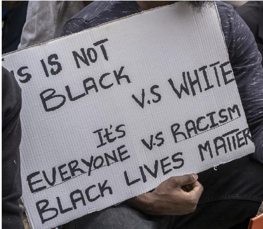
Εικόνα 8: Πλακάτ σε διαδήλωση του κινήματος που αναγράφει «Δεν είναι Μαύροι εναντίον Λευκών, είναι όλοι εναντίον του ρατσισμού» 39