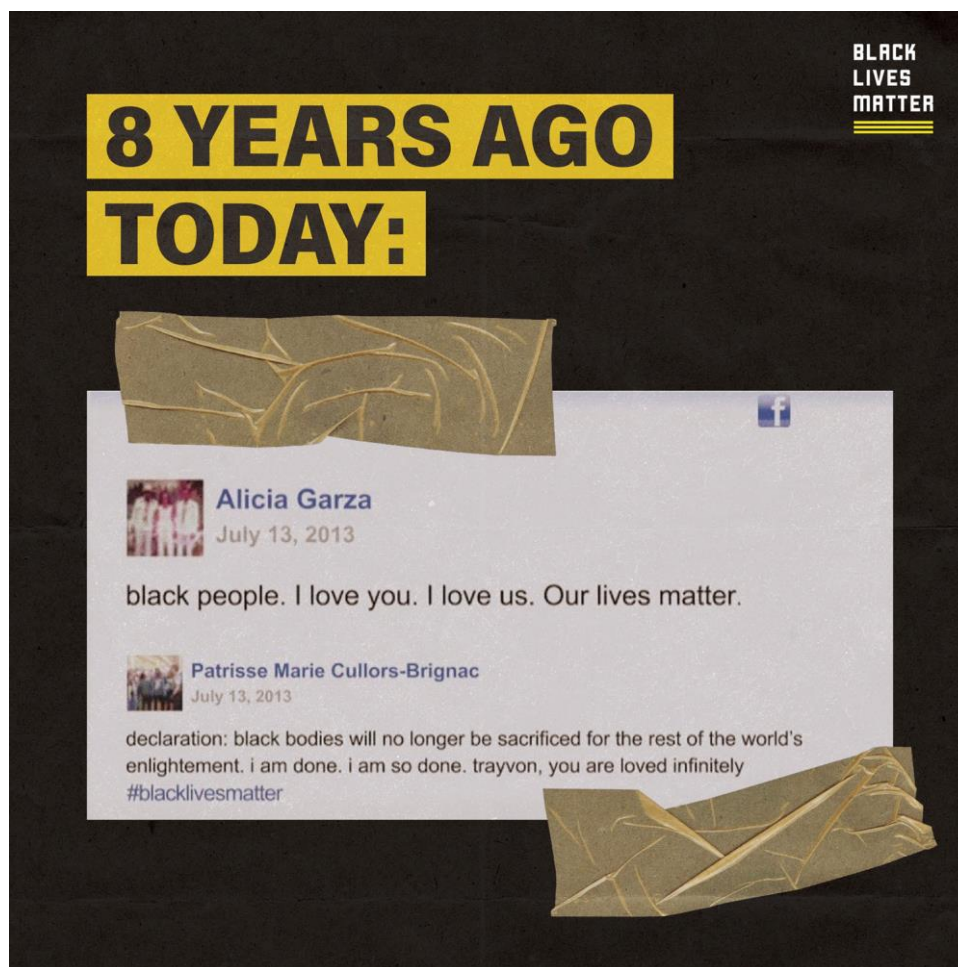
Εικόνα 1: Black Lives Matter (2021) Black Lives Matter 8 years ago today [online]. Διαθέσιμο στο: https://blacklivesmatter.com/8-years-strong/ (Τελευταία Πρόσβαση: 02/12/2021).

Αυτή η αλληλεπίδραση των δύο ακτιβιστριών εκφράζει συναισθήματα αγάπης προς τη μαύρη κοινότητα ενώ ταυτόχρονα ξεκαθαρίζει ότι οι κρατικές δολοφονίες μαύρων υποκειμένων δεν θα γίνουν ανεκτές πια. Η φράση «τα μαύρα σώματα δεν θα θυσιαστούν πια για τον διαφωτισμό του υπόλοιπου κόσμου» της Κουλόρς συνδέει το βίαιο και σκοτεινό παρελθόν της μαύρης ιστορίας της Αμερικής με το παρόν, το οποίο δρα με κεκαλυμμένες πρακτικές καταστολής και ελέγχου πάνω στον μαύρο πληθυσμό 200 χρόνια μετά την κατάργηση της δουλείας. Γίνεται πλέον ξεκάθαρο ότι το προπατορικό αμάρτημα της Αμερικής δεν έχει εξαλειφθεί, απλώς εξελίχθηκε σε διαφορετικές τεχνικές διάχυσης του ρατσιστικού λόγου και ρύθμισης της μαύρης ζωής. Ο Φουκώ εξηγεί την ανάδυση του ρατσισμού κατά τον 19 ο αιώνα μέσα από τη διαλεκτική σχέση των παλαιών τεχνικών εξουσίας αίματος και των επακόλουθων τεχνικών εξουσίας μέσω της σεξουαλικότητας. Απόπειρες για την προστασία της φυλής και την καθαρότητα του αίματος έγιναν μέσω βιοπολιτικών τεχνικών ρύθμισης και ελέγχου της αναπαραγωγής, της οικογένειας και της