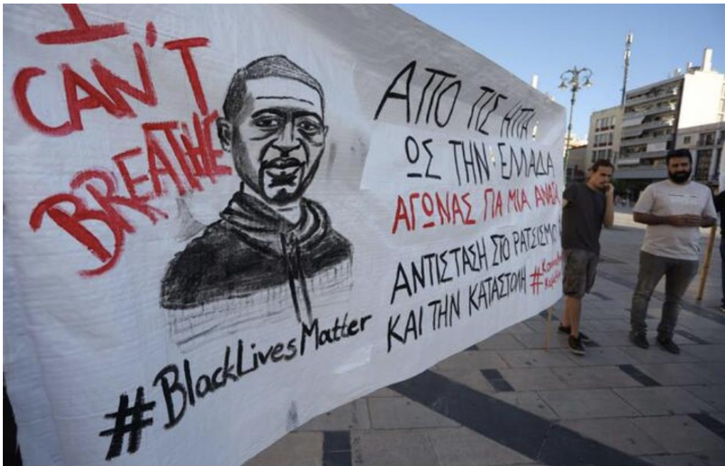
Εικόνα 3: Πανό στη μνήμη του Τζόρτζ Φλόυντ στην πορεία της 3ης Ιουνίου 2020 στο κέντρο της Αθήνας 14 .