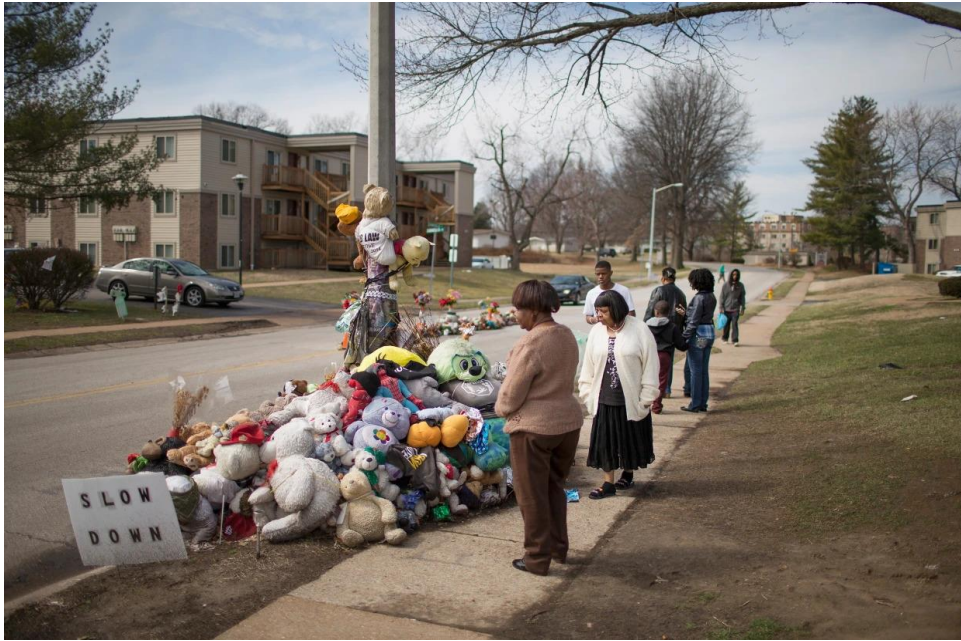
Εικόνα 4: Αυτοσχέδιο μνημείο προς τιμήν του δολοφονημένου Μάικλ Μπράουν από τον αστυνομικό Ντάρεν Ουίλσον 15 .

Όπως αναφέρθηκε ήδη, το κίνημα αποτελεί ένα λαϊκό δίκτυο με χαρακτήρα αυτο-οργάνωσης. Παρά την ιδιαίτερη οργάνωσή του, το Black Lives Matter διαθέτει κάποια από τα χαρακτηριστικά που περιγράφει η θεωρία των νέων κοινωνικών κινημάτων. Για τον Τουρέν (Tourraine, 1978: 113-114 στο Ψημίτης, 2011: 135) τα νέα κοινωνικά κινήματα αγωνίζονται για έναν συγκεκριμένο πληθυσμό που στην περίπτωση του Black Lives Matter είναι ο μαύρος. Ένα δεύτερο χαρακτηριστικό που εντοπίζει είναι ότι οι δράσεις τους στο όνομα του αγώνα επιδεικνύουν ένα επίπεδο οργάνωσης, κάτι που εντοπίζεται και στο Black Lives Matter, ενώ ταυτόχρονα υπάρχει ένας συγκεκριμένος αντίπαλος, στη συγκεκριμένη περίπτωση ο θεσμικός ρατσισμός του αμερικανικού συστήματος. Τέλος, προκειμένου ένα κίνημα να μπορεί να χαρακτηριστεί κοινωνικό, πρέπει το ζήτημα για το οποίο συγκρούεται με τον αντίπαλο να αφορά το σύνολο της κοινωνίας, όπως η κρατική ρατσιστική βία των ΗΠΑ στην περίπτωση του Black Lives Matter.