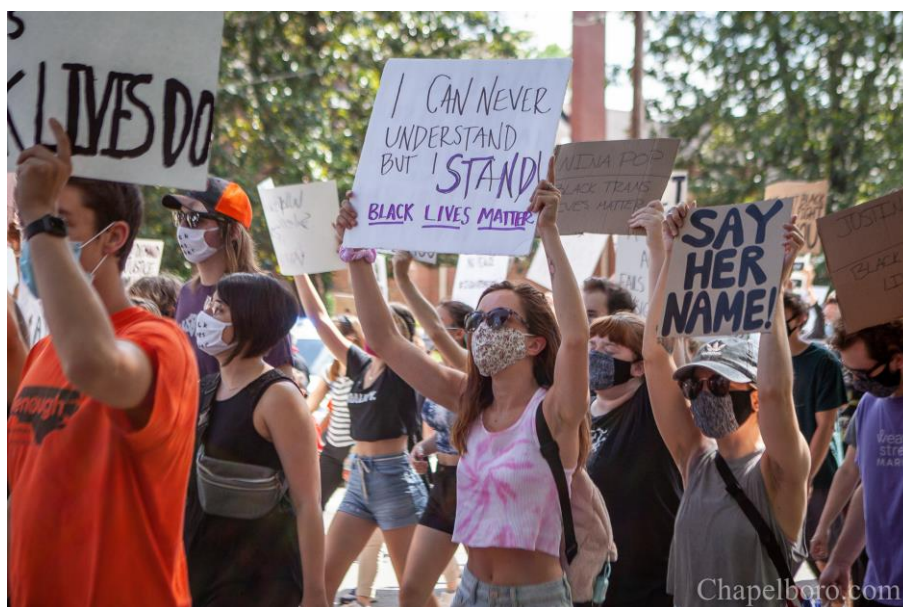
Εικόνα 11: Πλακάτ σε διαδήλωση στο Χίλσμπορο στις 05/06/2020 που αναγράφει «Δεν θα μπορέσω ποτέ να καταλάβω, όμως στέκομαι υπέρ [του αγώνα]» 42